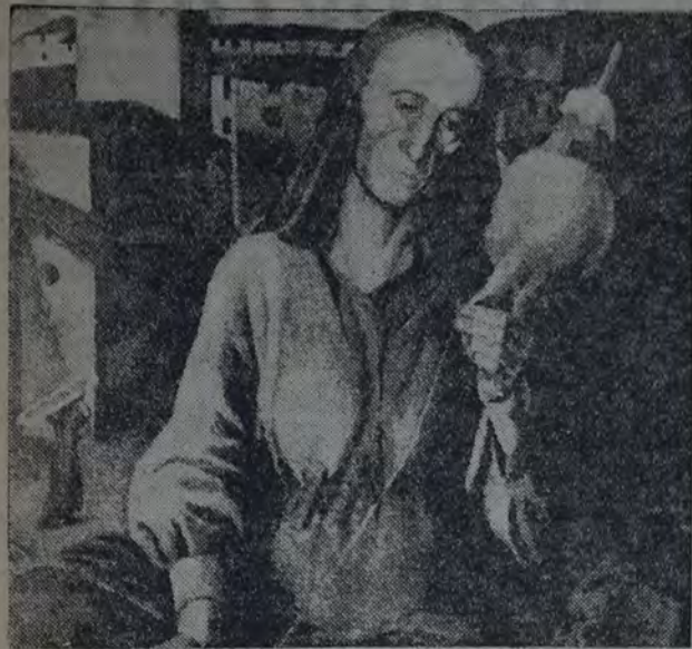
FRANCISCO VIDAL — "Vieja hilando"

El primer día de la primavera, según es tradicional, se inauguró el XVIII Salón de Bellas Artes. Concurran a él, hoy más que ayer, los artistas orientados hacia nuevos rumbos. Pareció atenderse a este sintoma destinándole a su obra sitios supuestos de honor. Este aspecto varió de las salas del Retiro, que si en nada varía el valor sustantivo de lo expuesto, tiene, no obstante, un significado. Implica romper con los límites confusos. O bien, implica reconocer méritos. Y es así, como según se mire, que las normas de ubicación no han variado. Antes ocupaban las primeras salas obras regidas por un concepto estético desechado ya. Hoy han cedido en categoría a los nuevos valores. Había, pues, que alegrarse.