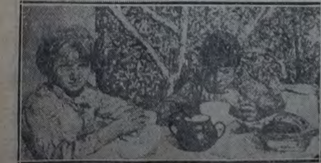
ENRIQUE POLICASTRO — "La rubia y el tito"