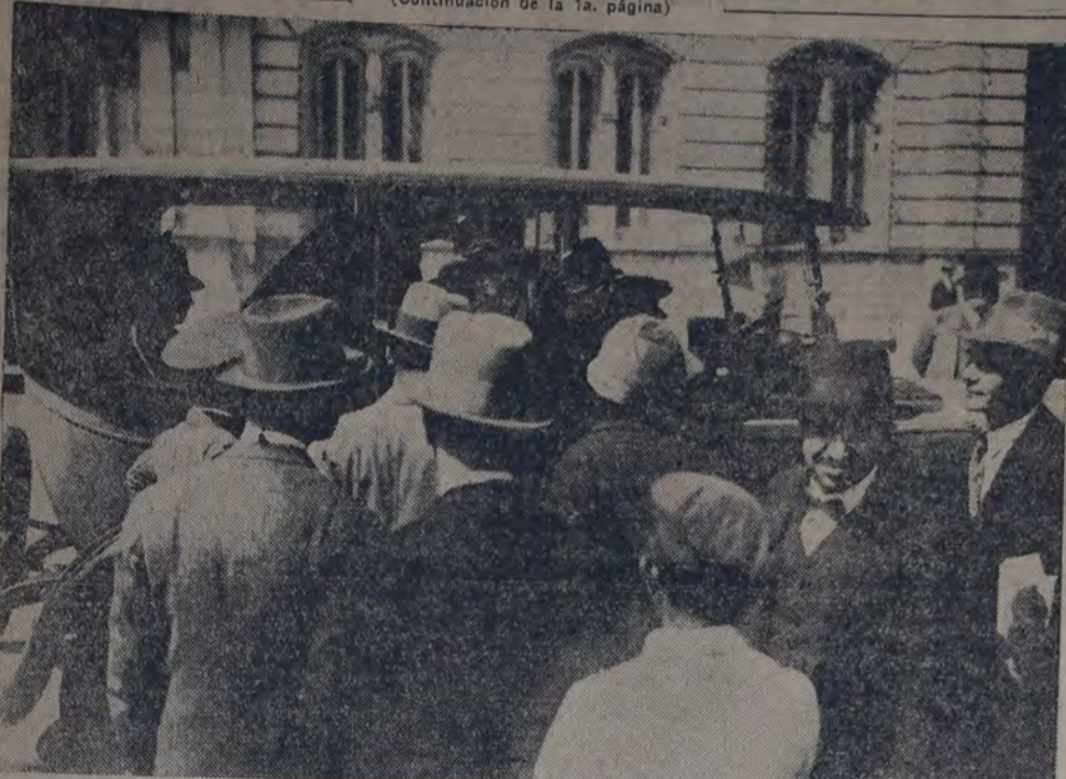
LAS SEÑORAS Y SEÑORITAS TAMBIEN SE MUESTRAN PARTIDARIAS DEL NUEVO SISTEMA DE TRANSPORTE. Aquí vemos a dos de ellas al tomar un taxi-óbus en plaza Mayo.

reclas en lo sucesivo, y ello contribuirá a crear una nueva mentalidad gremial en este numeroso núcleo de trabajadores.