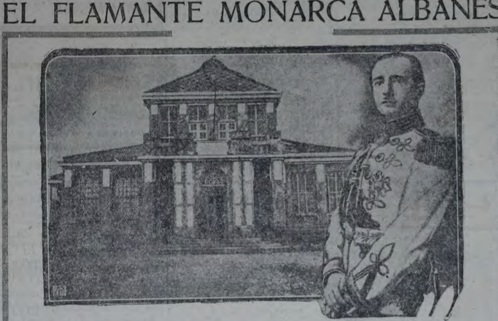
Este personaje del flamante uniforme no es un nuevo astro de Hollywood, aunque es probable que acabe contratado por alguna empresa cinematográfica yanqui para hacer el rol de rey en alguna película en series. Se trata nada menos que de Ahmed Zogú, rey de Albania por voluntad de Mussolini. Es curioso que mientras se presenta muy poco halagüeño el porvenir de los tronos de Europa a los albaneses se les haya ocurrido convertir en soberano a su presidente. En el grabado aparece el afortunado monarca delante del Capitolio Albanés, donde tuvo lugar la aparatosa proclamación.